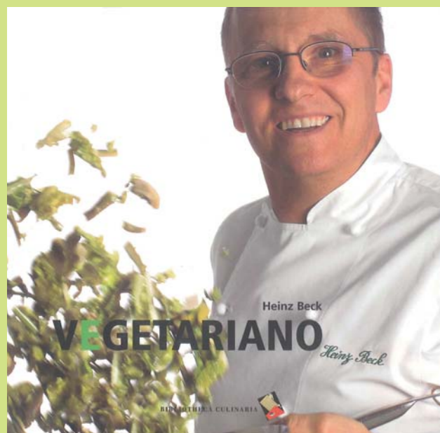
Heinz Beck VEGETARIANO 2005, Bibliotheca Culinaria

Pochi chef hanno prestato la loro attenzione alla verdura. Maggiormente attratti dalle possibilità di ingredienti più nobili, tendono a relegare le delizie dell'orto ad un semplice ruolo di comparse. La tendenza attuale per il cibo impiattato ha ulteriormente confinato gli ortaggi in secondo piano. Il contorno di una volta è oggi una guarnizione, chic ma decisamente minimalista. In modo alquanto paradossale, la generazione più ossessionata dall'igiene salustica e dall'aspetto fisico ha bandito i suoi migliori alleati.